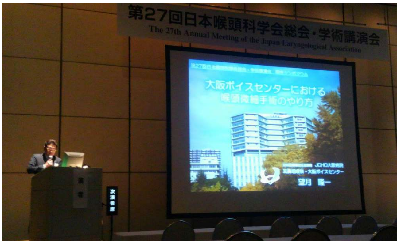
第27回日本喉頭科学会 臨床シンポジウム 喉を守る 声帯膜様部病変に対する喉頭微細手術 私のやり方 演者：望月隆一先生