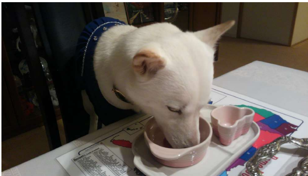
図1：まてっ。図2：よしっ。